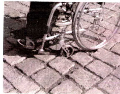
In zu großen Pflasterfugen bleibt der Rollstuhl stecken