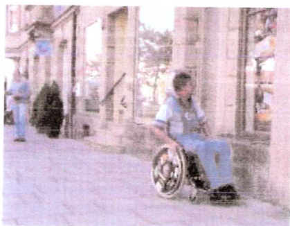
leicht befahrbarer Plattenbelag entlang der Schaufensterfront