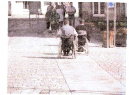
gemeinsam auf dem Weg in Kronachs barrierefreie Zukunft