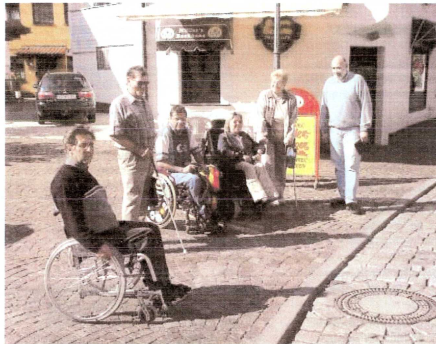
Bei allen Detailabstimmungen: enge Kooperation zwischen Stadtverwaltung und den Behinderteninitiativen – wie hier, bei einem der zahlreichen Ortstermine