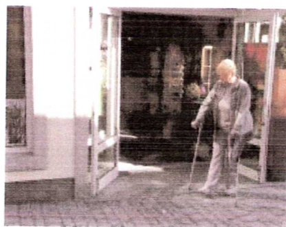
Erreichbarkeit durch barrierefreie Ladenzugänge in der Innenstadt