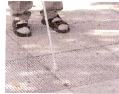
Rillenprofilplatten machen den Sehbehinderten auf Hindernisse aufmerksam