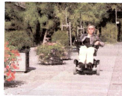
leicht befahrbarer Plattenbelag in der Kronacher Altstadt